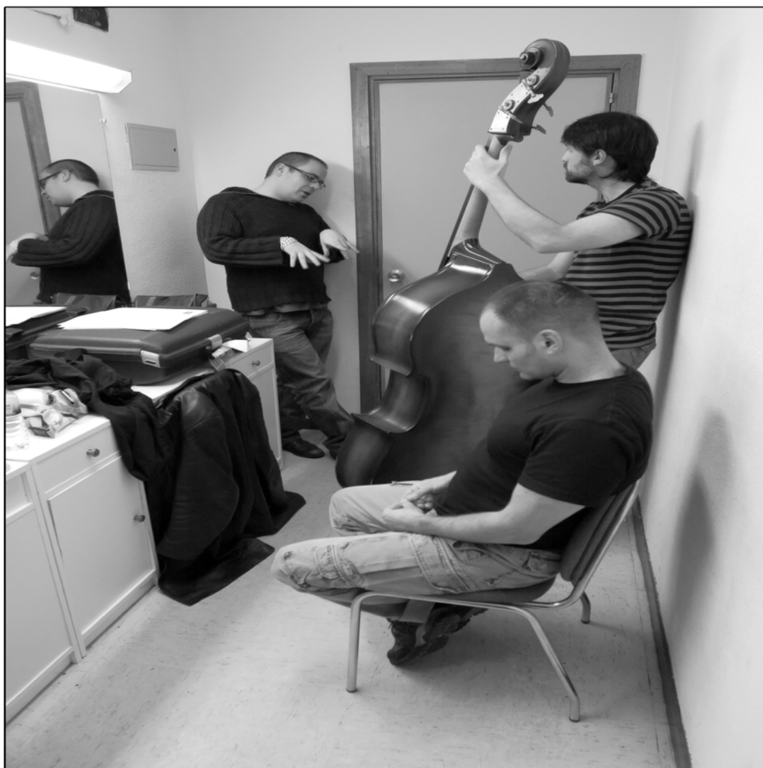
ABE RÁBADE TRIO · Fotografía de Sergio Calbanillas, Madrid, 2008.

Ofrece conciertos en el ámbito estatal e internacional, destacando los principales Festivales del estado español, así como conciertos en París y Toulouse (Francia), Berlín, Munich y Kiel (Alemania), Lausanne (Suíza), Porto, Lisboa y Madeira (Portugal), Tánger (Marruecos), Boston (USA), Birmingham (UK), La Habana (Cuba), Helsinki (Finlandia), Salvador de Bahía (Brasil), entre otros.